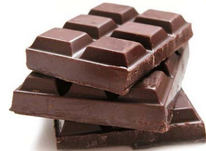
Cobertura de chocolate