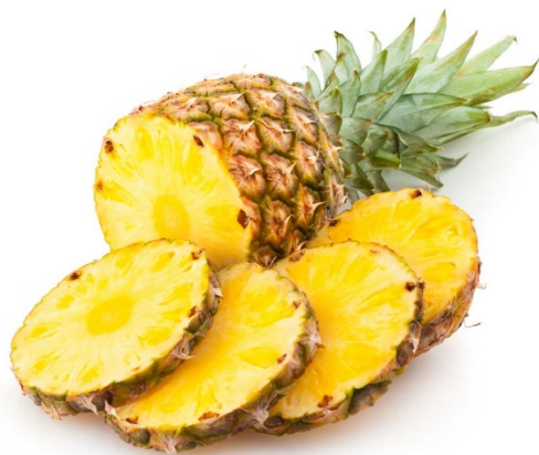
Miembro AP 1