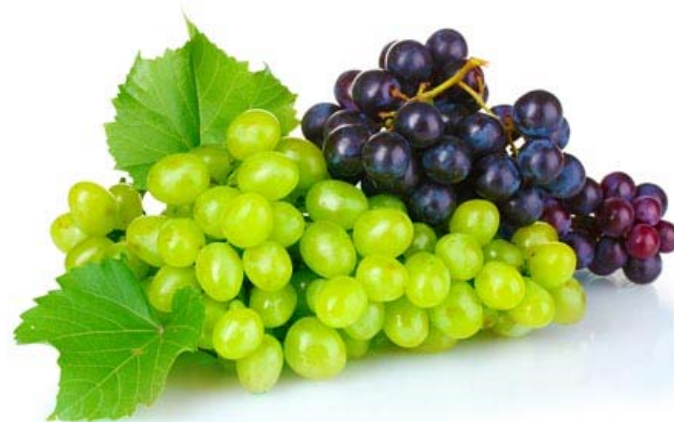
Miembro AP 3