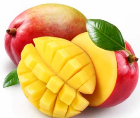
Miembro AP 2