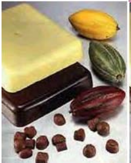
Manteca de Cacao