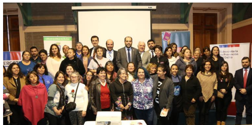
Capacitación para la formalización de los vendedores ambulantes